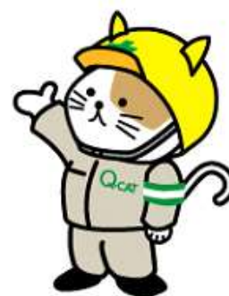
Q-CATマスコットキャラクター Q太くん

自動セットの保険制度であるため、工事ごとの保証書は発行されません。事故発生時に、認定品の適切な使用が確認された場合に保険金が支払われます。