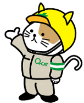
Q-CATマスコットキャラクター Q太くん

自動セットの保険制度であるため、工事ごとの保証書は発行されません。事故発生時に、認定品の適切な使用が確認された場合に保険金が支払われます。